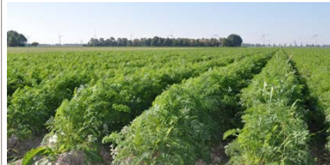
Foto: Winterpeen in september

Biologische en gangbare akkerbouwers en vollegrondsgroenteteelers maken zich zorgen over het verval van hun bodemkwaliteit. Niet-kerende grondbewerking in combinatie met vaste rijpaden kan een manier zijn om de Nederlandse bodem weerbaarder te maken voor de veranderende klimaatinvloeden.